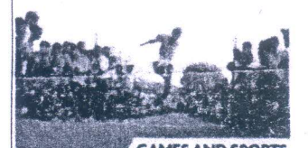
GAMES AND SPORTS