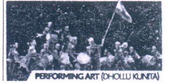
PERFORMING ART (DHOLLU KUNTA)