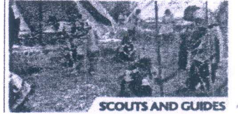
SCOUTS AND GUIDES